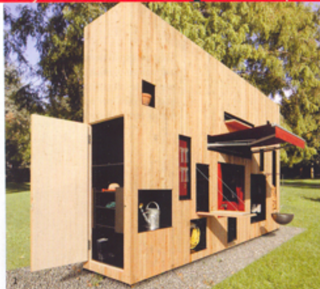
1 De multifunctionele Walden-wand. 2 Kapstok Trickstick van Patrick Frei en Markus Boge. 3 Kapstok Rechenbeispiel kan worden uitgebreid met een spiegel, memoboord, sleutelrek en een kinderkapstok. 4 Lezen, slapen, eten, opbergen: met Moormanns kast Lese+Lebe kan het allemaal.