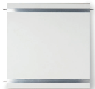
A Verbindungstablare connecting board